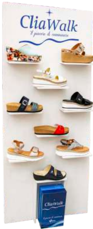
Espositore Premium (con un ordine minimo di 120 paia)