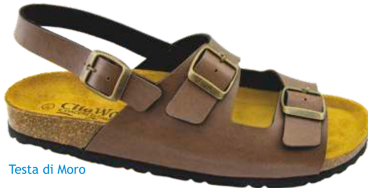
Testa di Moro