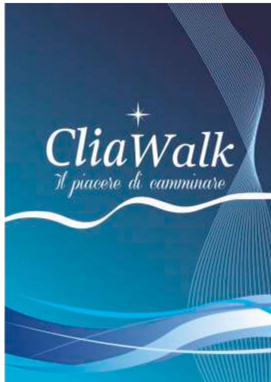
Cartello Vetrina Istituzionale