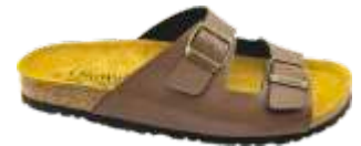
Testa di Moro