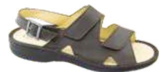
Testa di Moro