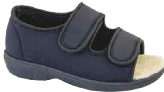
Elastica 3 Donna XL dal 35 al 41 Colori: Nero