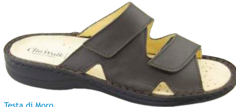
Testa di Moro