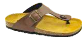
Testa di Moro