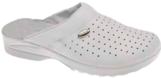
Dinamic New XXL dal 35 al 46 Colori: Bianco, Blu